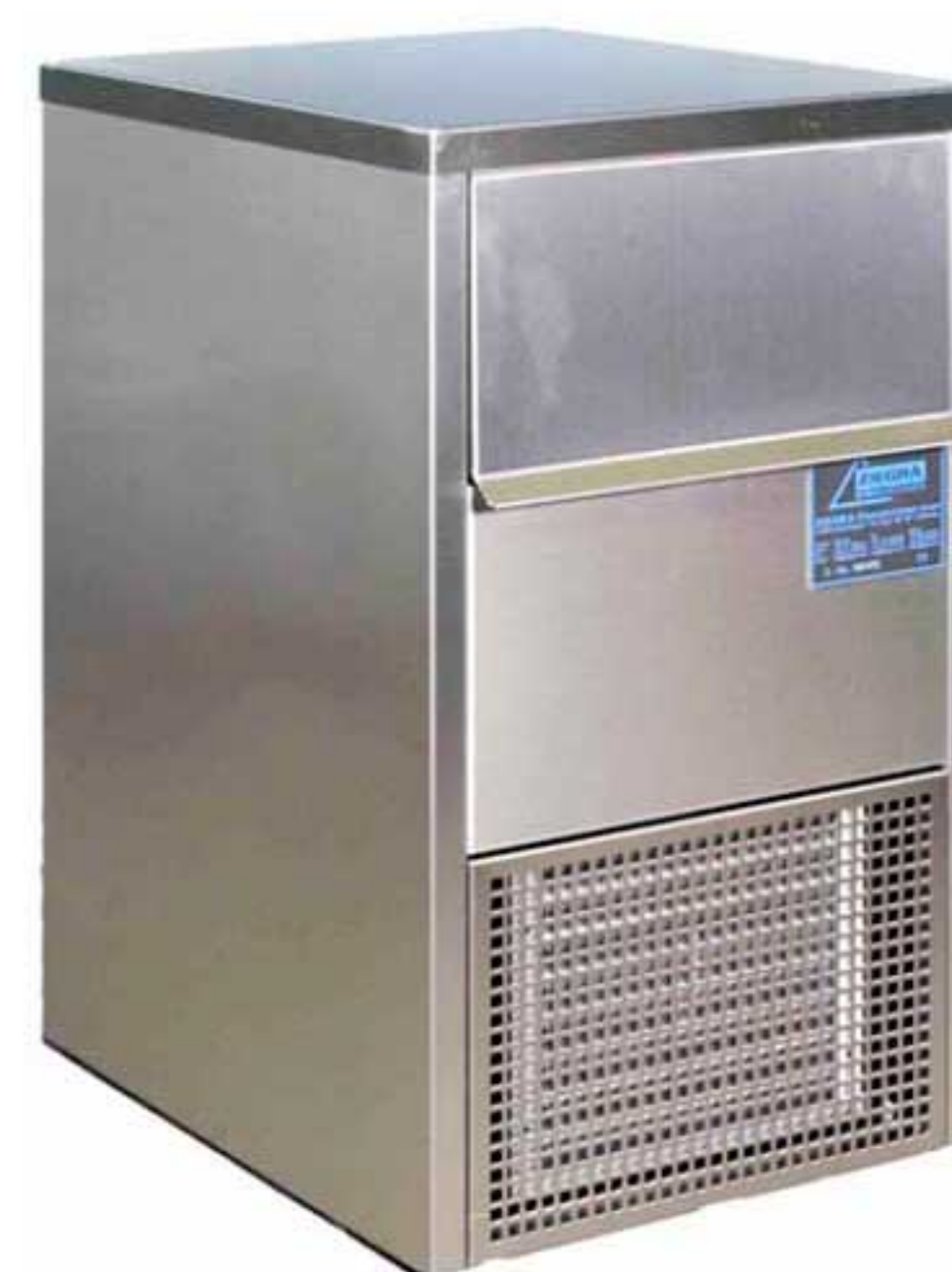
...en una caja de acero inoxidable robusta