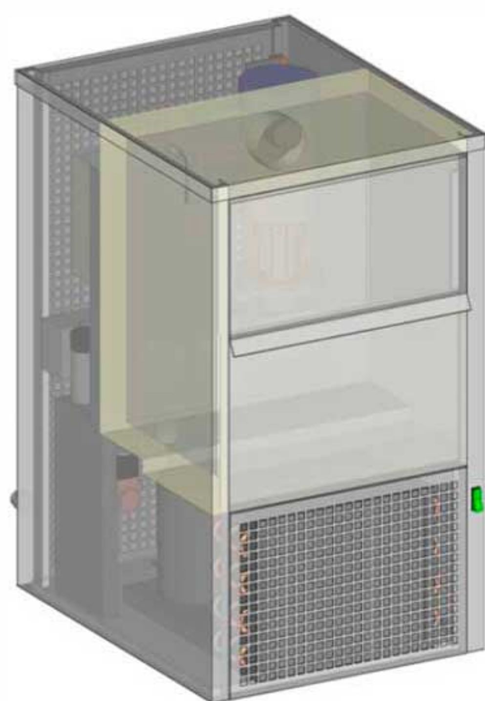
Componentes de alta calidad ...