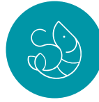
PRODUCTOS DEL MAR