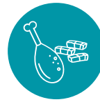
CARNES Y EMBUTIDOS