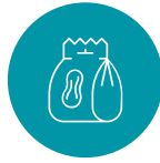
FRUTOS SECOS Y SNACKS